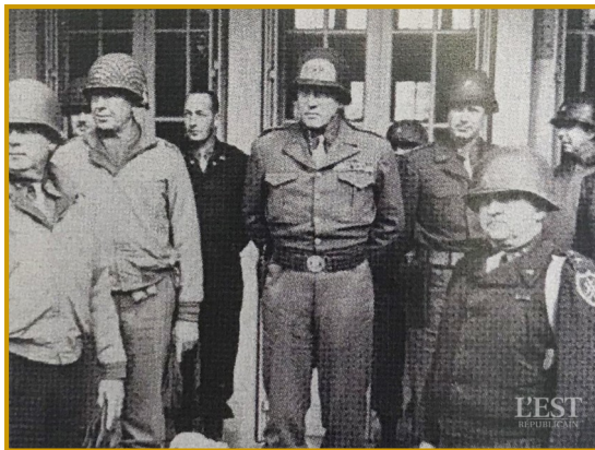
Le général Patton est resté près d'une semaine à Étain pour organiser le reste des libérations.

Extrait de l'article paru dans l'est républicain le dimanche 1 er septembre 2019, édition de Bar-le-Duc